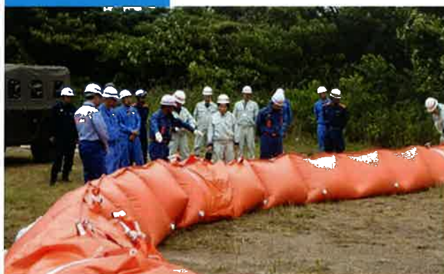
水防資機材の保管、提供