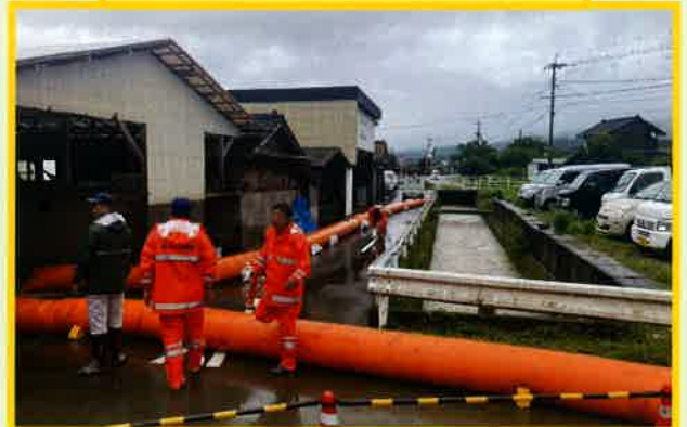
水防工法(大型水のう)