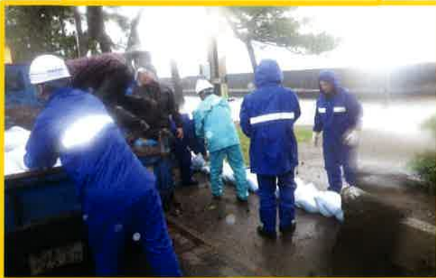
水防工法(土のう積み)