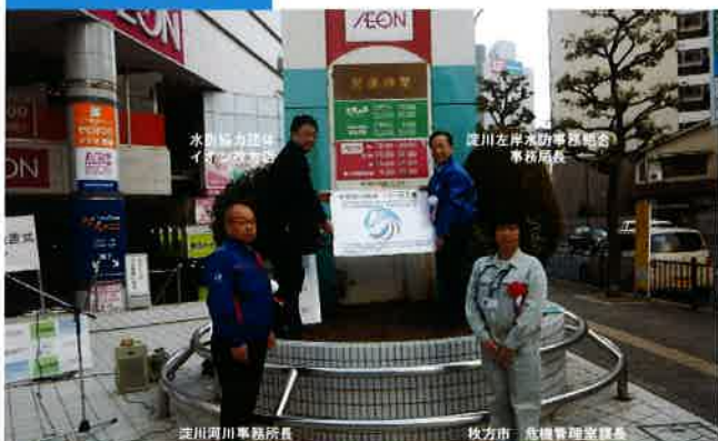
商業施設による水防に関する啓発の協力